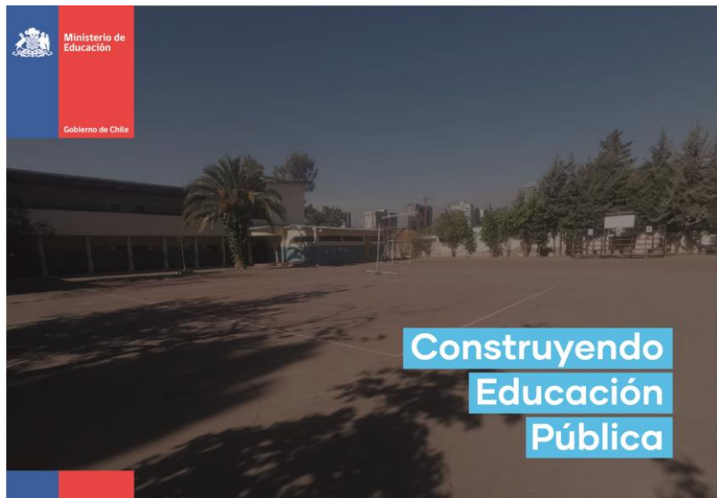
Imagen n°1: Letrero proyecto Conservación patio principal escuela de la industria gráfica Héctor Gómez Matus.